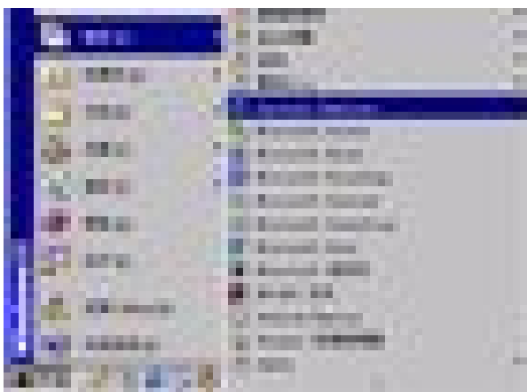
图 1 进入网页浏览界面操作图

可通过两种方式进入网页浏览页面：一是，双击（迅速点击鼠标左键两次）电脑桌面上的【Internet Explorer】图标；二是，点击桌面左下角的【开始】按钮，接着将鼠标移到随即弹出的界面中的【程序】处，此时会在右边弹出另一个界面，再将鼠标移到【Internet Explorer】图标处点击此图标（点击鼠标左键一次），参见图 1；紧接着将进入到网页浏览界面。