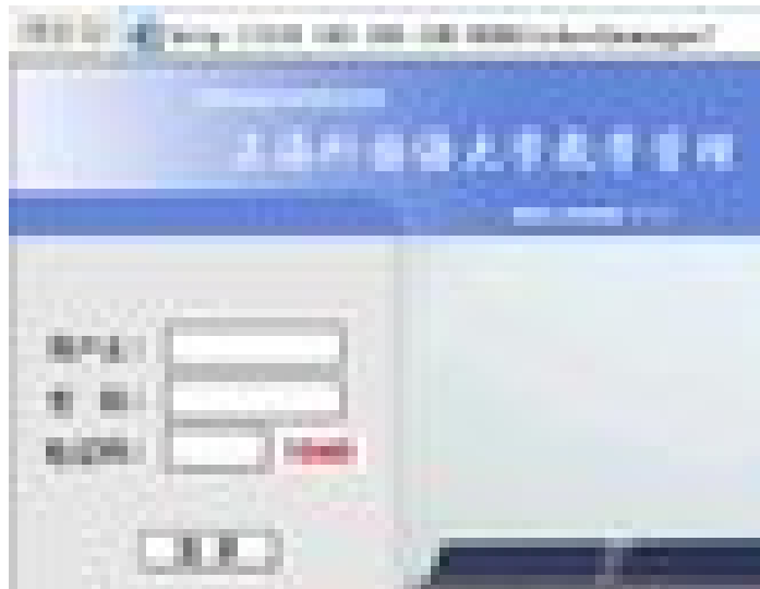
图 3 选课系统登录页面