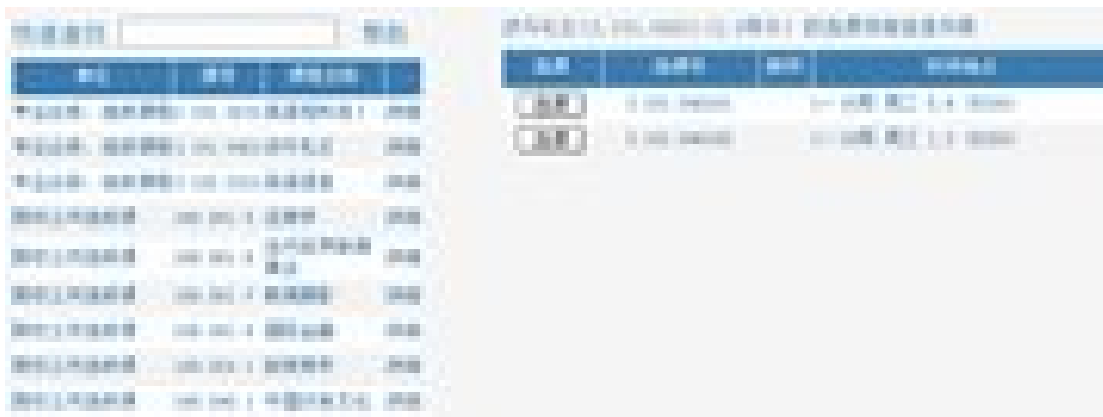
图 5 为同一门课程所开设的多个班级

由于全校开设的课程较多，这些课程会显示在不同的页面中，可点击图 4 中的“上页”和“下页”按钮，来查看所有的课程。