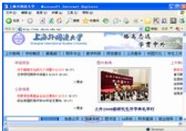
图 2 登录上海外国语大学主页

http://58.32.217.40:8080/schoolmanager/ 链接，即可进入选课系统登录页面（如图 3 所示）。