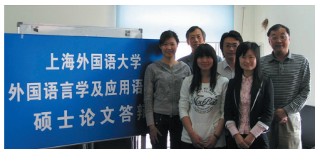
上海外国语大学 外国语言学及应用语言学 硕士论文答辩

外国语言学及应用语言学专业的硕士生在学习毕业后将具备语言研究、社会调查、语言工程技术和语言教学等领域所需要的基本语言学知识和技能，可视其兴趣和需要，选择继续深造或从事语言教育、编辑出版、语言技术开发、文字处理等工作。