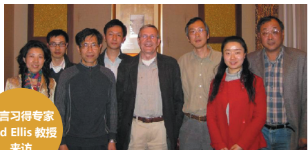
语言习得专家 Rod Ellis 教授 来访

外国语言学及应用语言学学科始建于1955年，1980年被批准为硕士点，1986年被批准为博士点，2003年被批准设立博士后流动工作站。本学科点是国内大学同类学科中最早设立的学科，在综合科研实力和高层次人才培养方面在全国名列前茅。