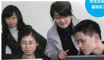
学生在实习 基地实习

各大国际组织经常委托高级官员和资深译员来学院讲课, 如联合国纽约总部、联合国日内瓦办事处、联合国维也纳办事处、联合国内罗毕办事处、欧盟欧委会、欧盟议会口译总司等。