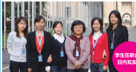
学生在联合国 日内瓦实习