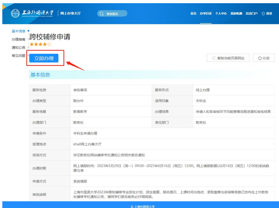
(图 2：跨校辅修申请进入页面)