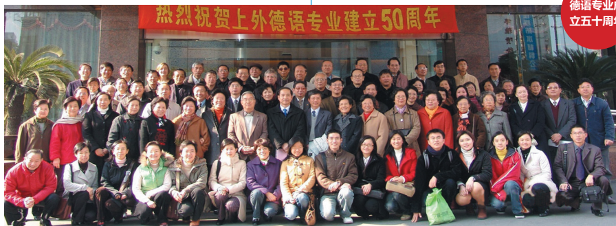
德语专业成 立五十周年

学科点师资力量雄厚，19名中国专业教师中，教授5人（含博士生导师4人），副教授8人，讲师6人。18人拥有博士学位，占学科师资的95%。1人获洪堡研究奖学金，1人获教育部新世纪优秀人才支持计划资助。所有教师均具有长期或较长时期在海外留学或访学的经历。此外，常年聘请有德国与奥地利文教专家各1名。