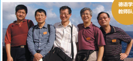
德语学科 教师队伍

德语硕士研究生培养分为德语文学、德语语言学、德汉翻译理论与实践和德语文化研究四个专业方向。专业必修课和专业选修课包括：德语文学研究概论、现代德语小说、现代德语诗歌、德语作品分析与讨论、德语语言学研究、语言学与应用语言学、现代德语语法学、德语修辞学、翻译理论与技巧、结构翻译学、德国文化与历史、德国史学导论、中德跨文化交际和外语教学法等。