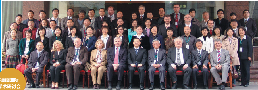
德语国际 学术研讨会

所培养的硕、博士研究生充分适应国家、上海市经济建设和社会发展的需要，在国家尤其是在上海的经济、文化、教育和科技事业中发挥了不可替代的作用。仅就上海地区而言，德、奥驻沪总领事馆及德国各大文化、经济代表处的主要德语翻译，绝大多数为本学科毕业生。