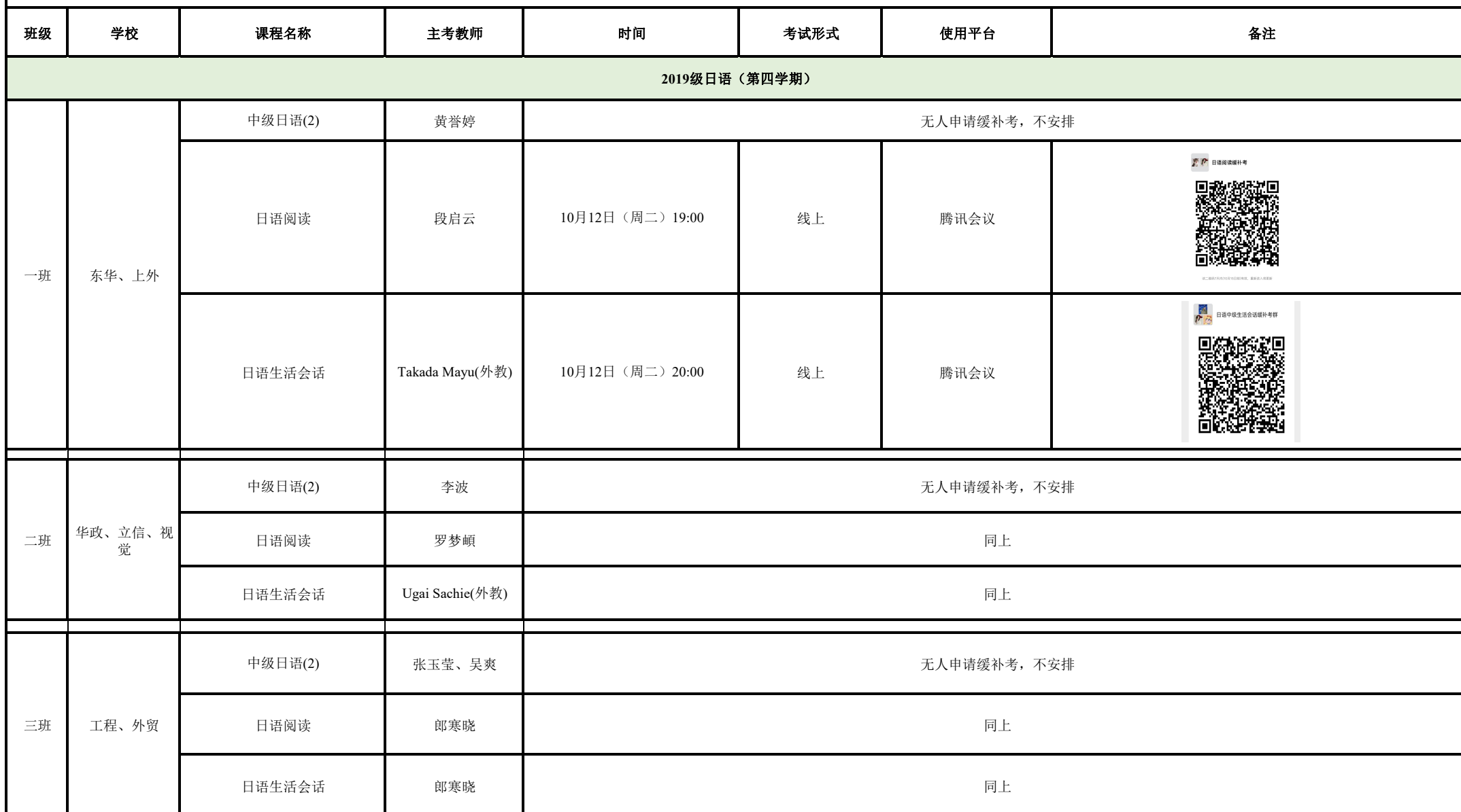
上海外国语大学2021年秋季学期松江校区辅修专业缓、补考安排表