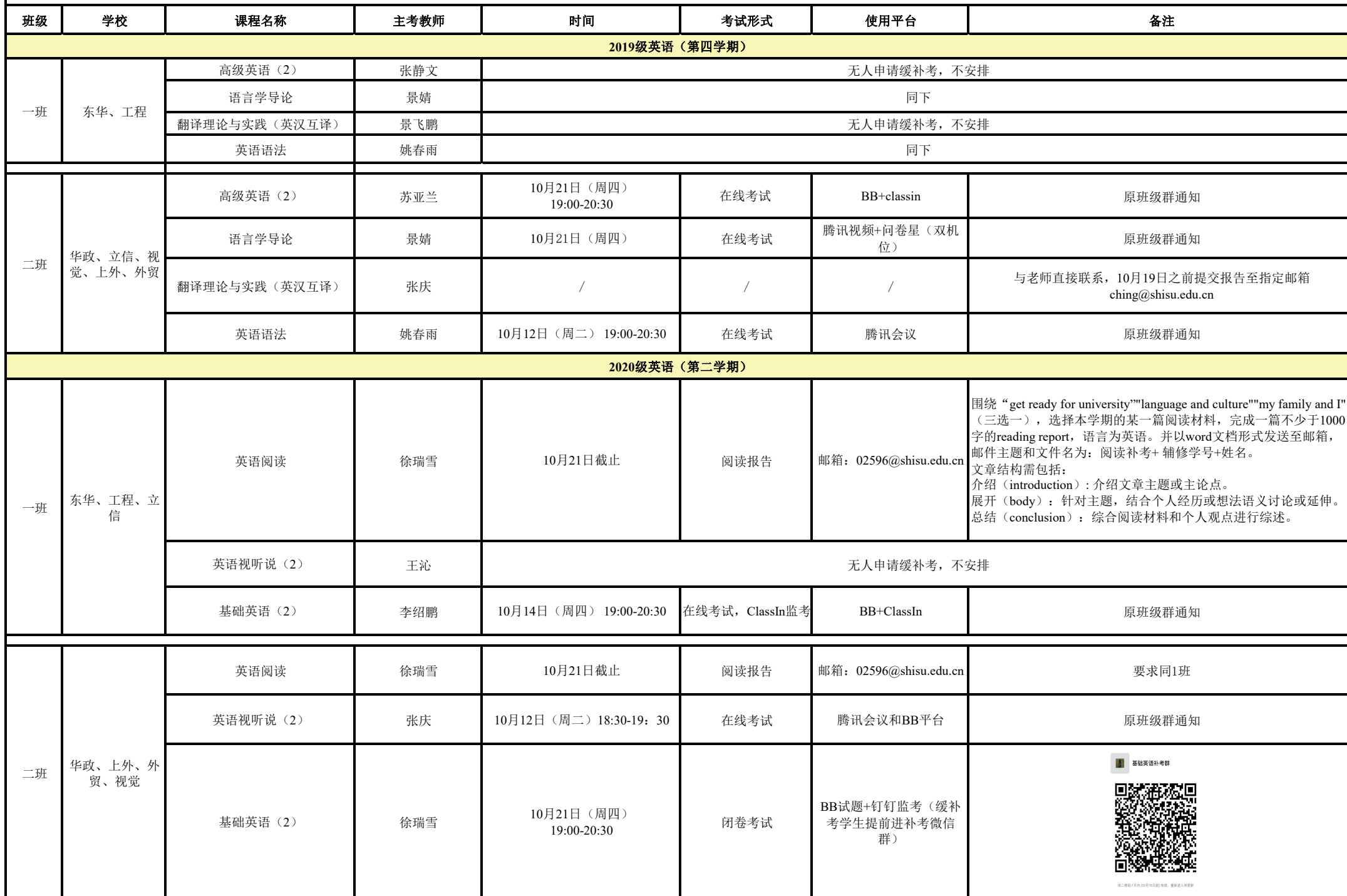
上海外国语大学2021年秋季学期松江校区辅修专业缓、补考安排表